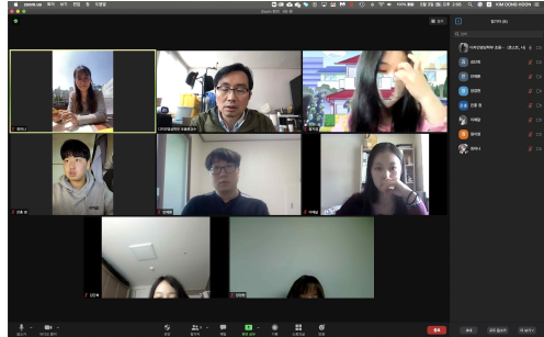
Zoom 수업을 통한 주제선정과정