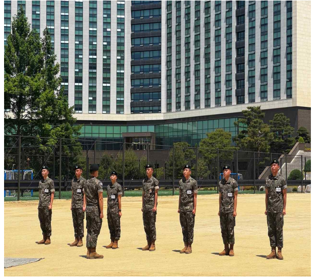
▲65기 임관종합평가 제식 준비 사진

백석대학교 육군 학군단 65기 후보생들이 2026년 4월 중 이른 아침 교내 운동장에서 5월 15일 임관종합평가를 대비한 체력단련을 실시하였다. 후보생들은 한자리에 모여 구슬땀을 흘리며 평가를 향한 준비에 최선을 다하였다.