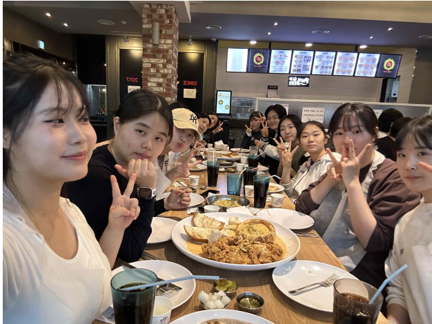
▲소통 간담회 식사시간