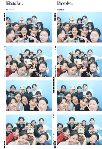
▲단장님과의 인생네컷 사진

백석대 육군 학군단이 2026년 4월 16일, 학군단장 주관으로 여후보생 소통 간담회가 진행되었다. 이번 간담회는 학군단 내 여후보생들의 건의사항을 청취하고, 보다 안전하고 보람찬 학군단 생활을 위한 발전 방향을 모색하기 위해 마련되었다.