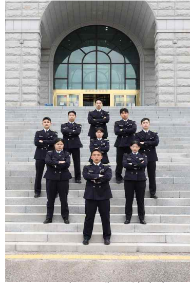
▲ 65기 2소대 졸업사진

백석대학교 육군 학군단 65기 후보생들이 2026년 4월 17일 단복을 착용하고 졸업앨범 촬영을 진행하였다. 개인 촬영과 단체 촬영 모두 성공적으로 마무리되었으며, 지금까지 함께 걸어온 시간을 사진 속에 담아내는 뜻깊은 자리가 되었다.