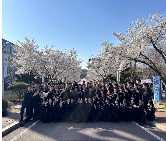
▲ 부총장님과 단체 사진

백석대학교 육군 학군단은 2026년 4월 7일 교내에 활짝 핀 벚꽃들을 보며 단장님, 교수님과 함께 뜻 깊은 시간을 보냈습니다. 베네스다 공원에서 65기, 66기 후보생들이 단체 사진 촬영을 했습니다.