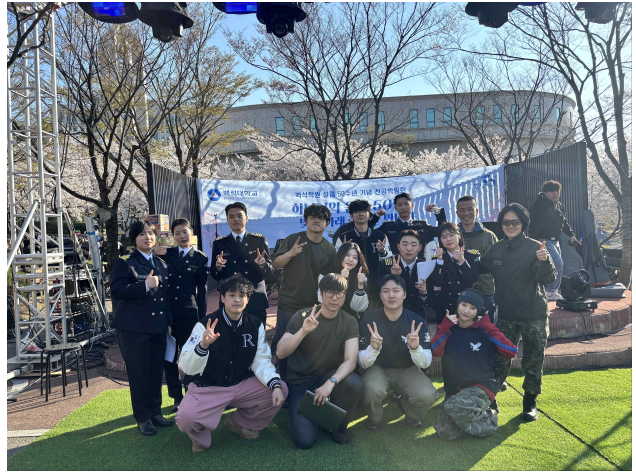
▲ 버스킹 마무리 사진

백석대 육군 학군단이 2026년 4월 9일부터 11일까지 학교내 캠퍼스에서 열린 벚꽃 축제를 맞아 친근하고 활기찬 육군 ROTC(학군단)의 이미지를 알리기 위한 특별한 홍보 활동을 전개하였다.