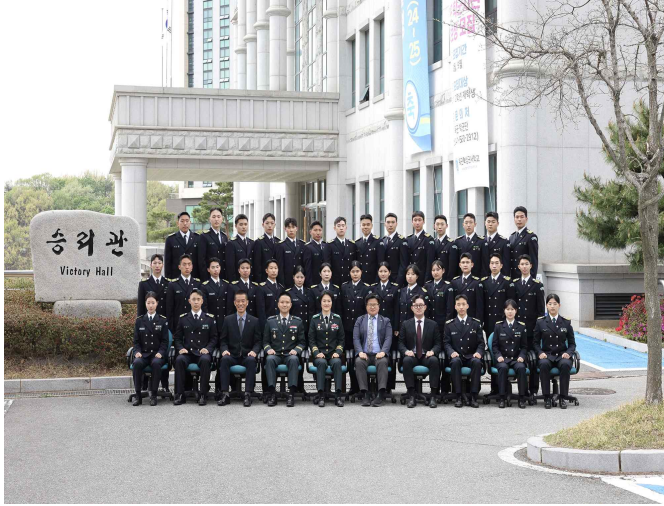
▲ 65기 단체 졸업 사진