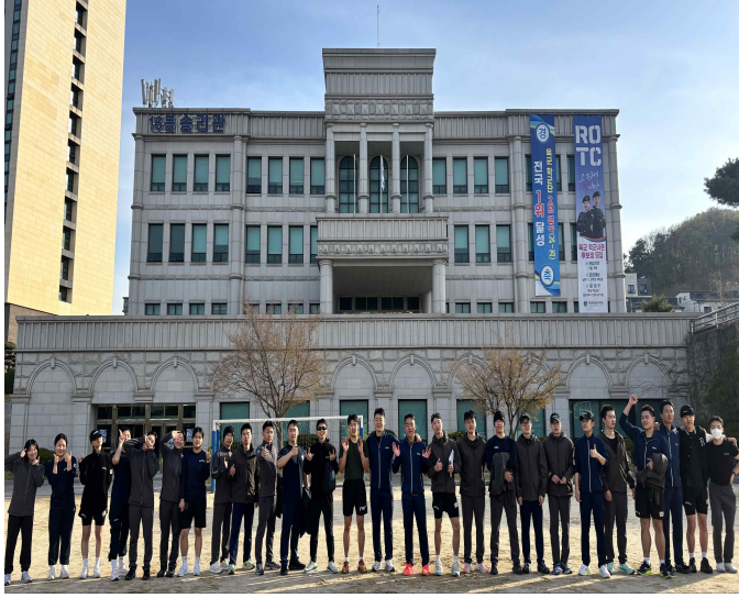
▲65기 임관종합평가 체력준비 사진