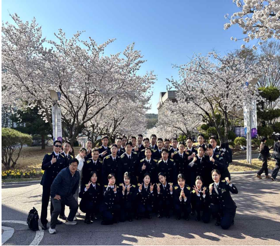
▲ 65기 단체 사진